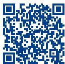
Apple App Store

Mit der kostenlosen CARAVAN SALON App bleiben Sie immer „up to date“. Erhältlich ist sie im Apple App Store, bei Google Play und unter www.caravan-salon.de . Oder scannen Sie einfach den QR-Code ein.