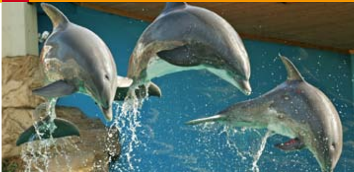
Zoo Duisburg, Wilms/Kuster

D er Duisburger Zoo blickt auf eine lange Geschichte zurück, 1934 gegründet beherbergt er heute über 1.800 Tiere in über 300 Arten. Bekanntheit haben die Tierpfleger des Zoos vor allem durch die erste und bislang erfolgreichste Zucht von Koalas in Europa erlangt. Immer wieder lockt der niedliche Nachwuchs die Besucher an.